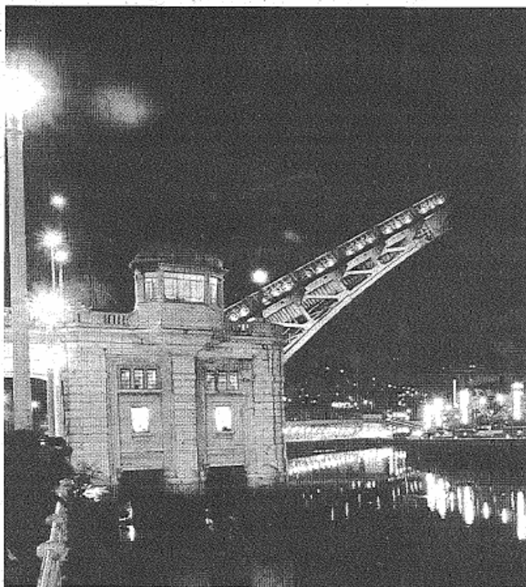
NOCTURNO. El Puente de Deusto abre sus brazos.